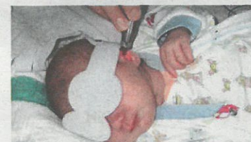
Laserakupunktur bei Babys